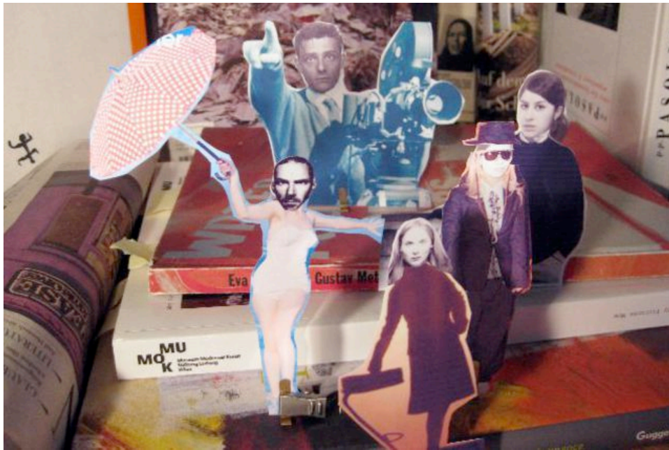
Wer bin ich? Beschreib mich, film mich, schau mich an!

In ihrer neusten Produktion geht die Zürcher Theatertruppe Bignotwendigkeit unterschiedlichsten Autobiografien auf den Grund.